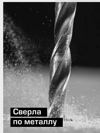
Сверла по металлу